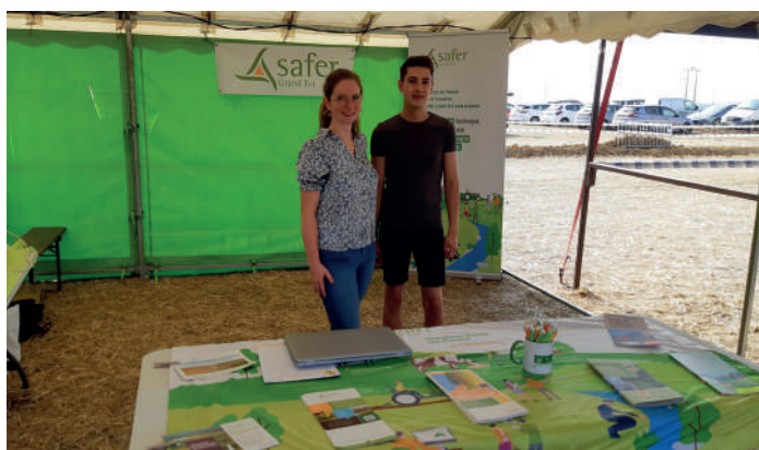
▲ Fête de l'Agriculture, Dommartin-le-Saint-Père, le 28 août.