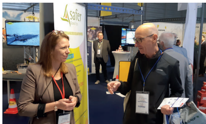
▲ Salons des communes et intercommunalités du Haut-Rhin, Mulhouse, le 22 septembre.