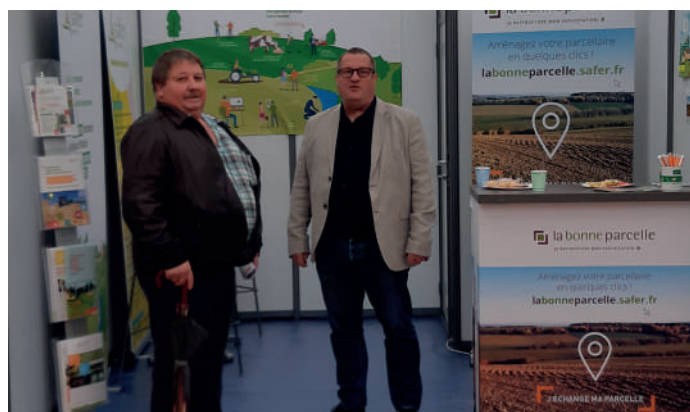
▲ Foire de Sedan, les 9, 10 & 11 septembre.